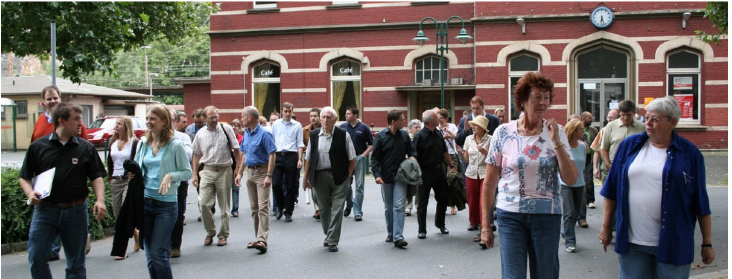
Bereits 2007 zeigte sich großes Bürgerinteresse an der Weiterentwicklung Gennas, als die CDU und Junge Union Letmathe zu einem Stadtrundgang durch diesen Ortsteil luden